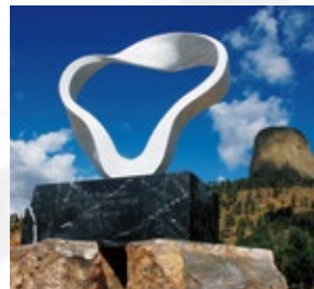
“CIRCLE WIND” -PAX2008-「聖なる煙」 ワイオミング州デビルスタワー-国定公園内 永久設置(アメリカ)