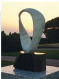
“CIRCLE WIND” -PAX2000- ローマ法王夏の離宮 カステル・ガンドルフォ 永久設置(バチカン市国)

イタリア・ローマ近郊のアトリエ、トスカーナ州ピエトラサンタ、近年は京都にも拠点をおき、独自の境地を切り拓く画家・彫刻家の武藤順九。これまで多くの作品を発表し、その創作活動を通じて、いのちの尊さをうたえ続けてきました。大自然の営為が造りだした大理石と向き合い生まれた作品「風の環（かぜのわ）」シリーズは、2000年、バチカン市国・ローマ法王夏の離宮カステル・ガンドルフォに、史上初の抽象彫刻として永久設置されました。2006年には、インド・釈迦悟りの地であり仏教の聖地、世界遺産でもあるマハボディ寺院に永久設置。2008年には、アメリカ合衆国ワイオミング州・ネイティブアメリカンの聖地であり世界で最初の国立モニュメント・デビルスタワーに永久設置されるなど、その営みは、世界有数の聖地に作品が永久設置されるという成果に結実し、各地で多くの感動を誘い、共感の環をひろげ、人間愛に根ざした世界平和への意義をアピールしてきました。2012年、東日本大震災 鎮魂と追悼のモニュメント建立プロジェクトから、3.11慰霊モニュメント製作の依頼を受け、宮城県石巻市南浜地区に予定されている復興祈念公園（仮称）内設置に向けて、現在、官民一体の取組が進行しています。アートプロジェクト高崎では、3.11慰霊モニュメント1/4モデルをはじめ、バチカン市国、ブダガヤ、デビルスタワーなど世界の聖地に永久設置されたモニュメントのハーフサイズを中心に、13点の彫刻作品を特別展示いたします。また、武藤順九独自の技法ネオフレスコによる新作絵画「コンポジション 生命の詩（いのちのうた）」は、今回が初出展となり、近年のネオフレスコによる大作、および墨絵とともに武藤順九の宇宙観を展示いたします。高崎の地で、世界にひろがる風を肌で感じ、武藤順九の宇宙を感じてください。