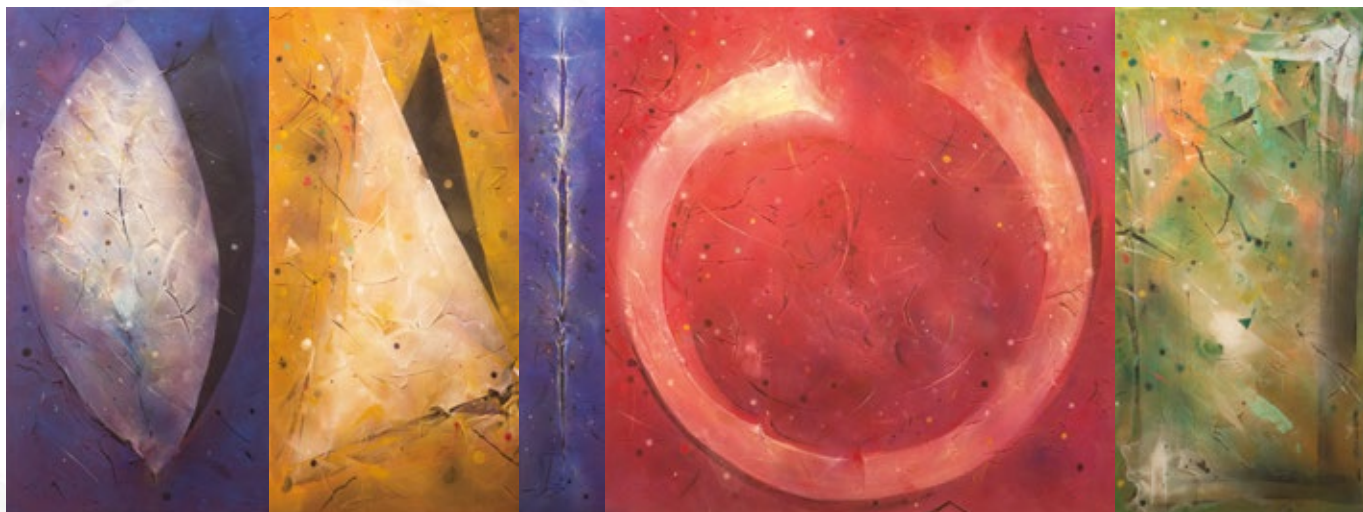
コンポジション 生命の詩 (いのちのうた) 2016. L.480×H.180cm ネオフレスコ