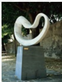
“CIRCLE WIND” -PAX2003- ピエトラサンタ 永久設置(イタリア)