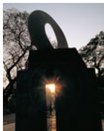
“CIRCLE WIND” -PAX2005- ブダガヤ・マハボディ寺院 (世界遺産)永久設置(インド)