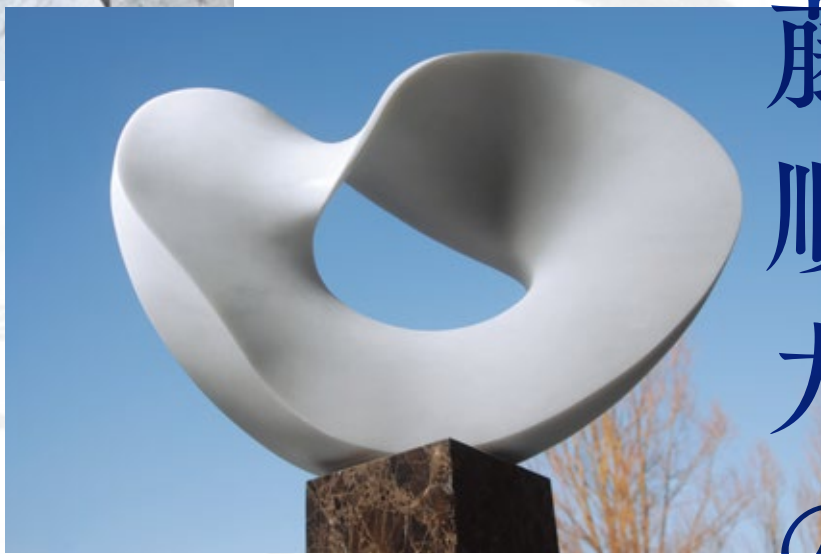
“CIRCLE WIND 2011” -絆- (東日本大震災3.11 慰霊モニュメント 1/4ファーストイメージモデル) 2011. H.64×L.80×S.26cm イタリア大理石

イタリア・ローマ近郊のアトリエ、トスカーナ州ピエトラサンタ、近年は京都にも拠点をおき、独自の境地を切り拓く画家・彫刻家の武藤順九。これまで多くの作品を発表し、その創作活動を通じて、いのちの尊さをうたえ続けてきました。大自然の営為が造りだした大理石と向き合い生まれた作品「風の環（かぜのわ）」シリーズは、2000年、バチカン市国・ローマ法王夏の離宮カステル・ガンドルフォに、史上初の抽象彫刻として永久設置されました。2006年には、インド・釈迦悟りの地であり仏教の聖地、世界遺産でもあるマハボディ寺院に永久設置。2008年には、アメリカ合衆国ワイオミング州・ネイティブアメリカンの聖地であり世界で最初の国立モニュメント・デビルスタワーに永久設置されるなど、その営みは、世界有数の聖地に作品が永久設置されるという成果に結実し、各地で多くの感動を誘い、共感の環をひろげ、人間愛に根ざした世界平和への意義をアピールしてきました。2012年、東日本大震災 鎮魂と追悼のモニュメント建立プロジェクトから、3.11慰霊モニュメント製作の依頼を受け、宮城県石巻市南浜地区に予定されている復興祈念公園（仮称）内設置に向けて、現在、官民一体の取組が進行しています。アートプロジェクト高崎では、3.11慰霊モニュメント1/4モデルをはじめ、バチカン市国、ブダガヤ、デビルスタワーなど世界の聖地に永久設置されたモニュメントのハーフサイズを中心に、13点の彫刻作品を特別展示いたします。また、武藤順九独自の技法ネオフレスコによる新作絵画「コンポジション 生命の詩（いのちのうた）」は、今回が初出展となり、近年のネオフレスコによる大作、および墨絵とともに武藤順九の宇宙観を展示いたします。高崎の地で、世界にひろがる風を肌で感じ、武藤順九の宇宙を感じてください。