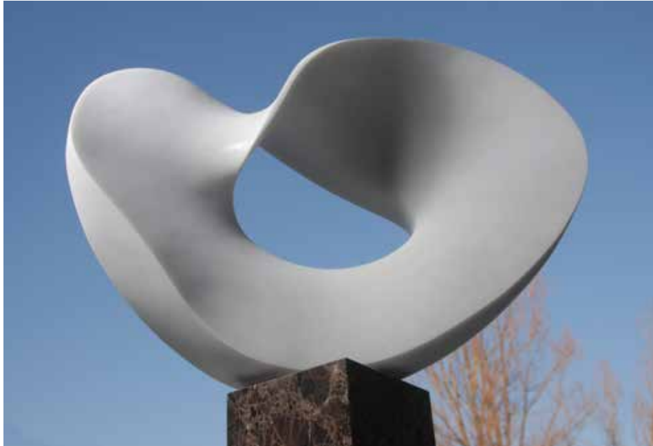
《東日本大震災3.11 慰霊モニュメント 1/8 ファーストイメージモデル》「風の環 2011 一絆一」 H.28 × L.36 × S.12cm / イタリア大理石 / 2014

バチカン、インド・ブッタガヤ、アメリカ・デビルタワーなど世界の聖地に「風の環」シリーズが永久設置され、世界的に評価されている大理石彫刻家 武藤順九の新作、近作の彫刻、石彩展。仙台市出身で「みやぎ絆大使」でもある氏は、東日本大震災鎮魂と追悼のモニュメント製作を官民一体プロジェクトから正式に依頼を受け、石巻市に予定されている「震災復興記念公園」内に 2020 年完成を目指して準備を進めています。