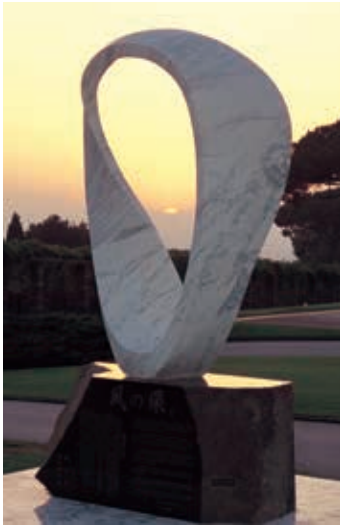
キリスト教の聖地バチカン Permanent installation at the Pope's Summer Imperia villa, Castelgandolfo, Vatican "CIRCLE WIND" -PAX2000- [Exhibition work: 1/2 size] 2011. H.114×L.84×S.39cm Italian marble ●5

In 2000, the "Circle Wind - PAX 2000" was installed at the Papal Official Residence of the Vatican City. In 2006, the "Circle Wind - PAX2005" was installed in the Mahabodhi Temple (World Heritage site) of Buddha Gaya, India, known as the birthplace of Buddhism, as a monument symbolizing world peace. And also in 2009, the "Circle Wind - PAX2008" was installed at National park of Devils Tower National Monument, Wyoming, USA as a message for future generations. Akishima-Showa no Mori Junkyu Muto Sculpture Museum will display 9 marble sculptural masterpieces including these memorable monument 1/2 models. Please fully enjoy the harmony of nature and art.