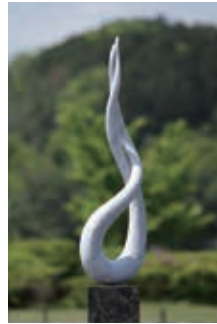
MALE AND FEMALE ●4 "男と女" 2011. H.104×L.32×S.16cm Italian marble