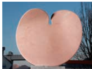
"DISK WIND" 2011. H.92×L.92×S.15cm Rosa Portugallo ●8