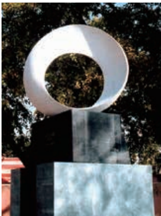
仏教の聖地インド・ブダガヤ Permanent installation at Mahabodhi Temple (The World Heritage), Buddha Gaya, India [Exhibition work: 1/2 size] "CIRCLE WIND" -PAX2005- 2011. H.100×L.110×S.23cm Italian marble ●6