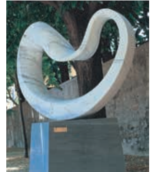
イタリア ピエトラサンタ Permanent installation in Pietrasanta, Italy "CIRCLE WIND" -PAX2003- [Exhibition work: 1/2 size] 2011. H.78×L.108×S.36cm Italian marble ●1