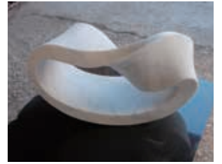
"CIRCLE WIND" 2011. H.52×L.90×S.45cm Italian marble ●2