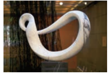
N.Y. 9.11 慰霊モニュメント For all victims of 9.11th "CIRCLE WIND" -PAX2011- 2011. H.72×L.112×S.24cm Italian marble ●9