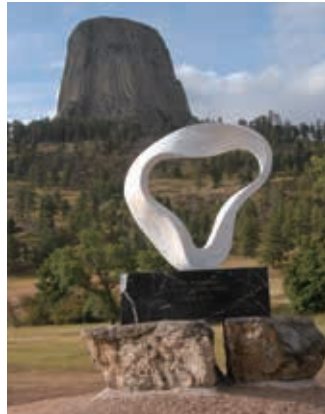
ネイティブ アメリカンの聖地 ワイオミング デビルスタワー Native American sacred place Wyoming Devils Tower "CIRCLE WIND" -PAX2008- [Exhibition work: 1/2 size] 2011. H.100×L.112 ×S.32cm Italian marble ●3