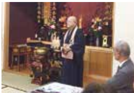
2016年10月17日 仙台市 少林寺 保春院にて