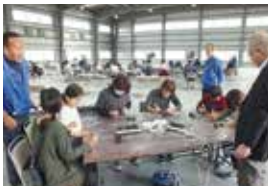
2017年4月22日 みよし市 愛知県トラック協会にて