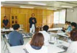
2016年7月9日 雄勝硯生産販売協同組合仮設工房にて