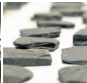
my 硯ブースの様子 2018年2月16日・17日 京都マラソン受付会場「おこしやす広場」にて